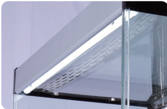
LED 조명 LED lighting