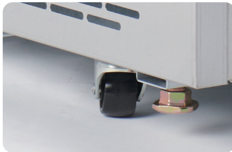
캐스터 바퀴 Universal wheels