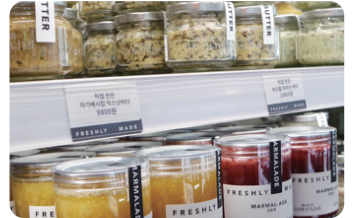
투명 프라이스 레일 Transparent price rail