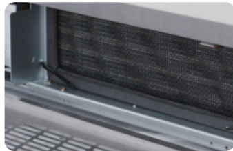
내치형 CDU Condensing unit