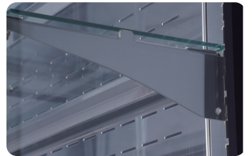
높낮이 조절 선반 Adjustable shelves