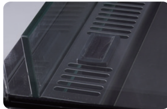
디지털 온도 표시기 Digital temp. display