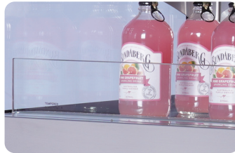
프론트 글라스 Front glass rail