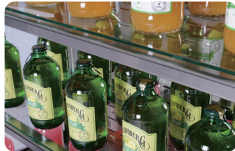
유리선반 Glass shelves