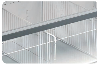
와이어 디바이더 Wire divider