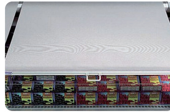
나이트 커버 Night cover