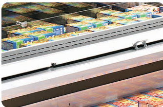
백투백 키트 Back to back KIT